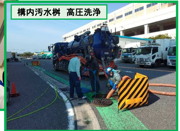
構内汚水樹 高圧洗浄