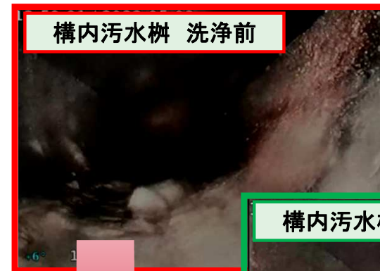
構内汚水樹 洗浄前