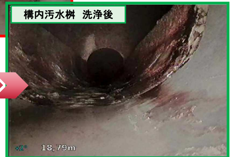
構内汚水樹 洗浄後