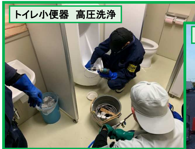
トイレ小便器 高圧洗浄