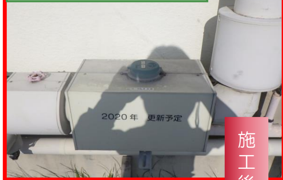
B-8号棟水道子メーター②