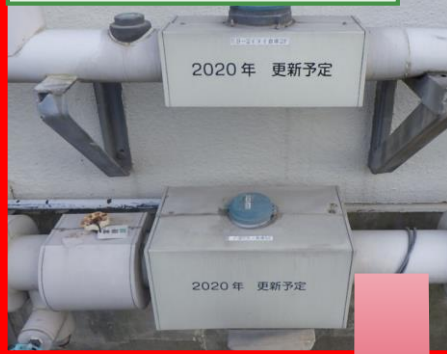
B-2号棟水道子メーター①