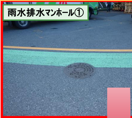
雨水排水マンホール①