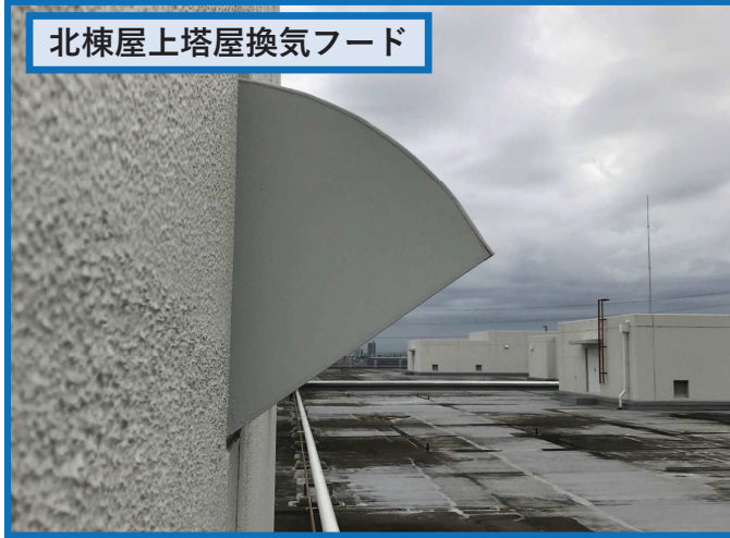
北棟屋上塔屋換気フード