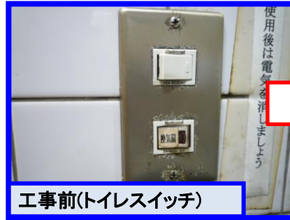
工事前(トイレスイッチ)