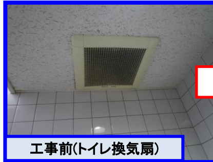
工事前(トイレ換気扇)