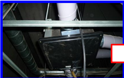
工事前(中間取付型ダクトファン)