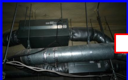
工事前(ストレートシロッコファン)