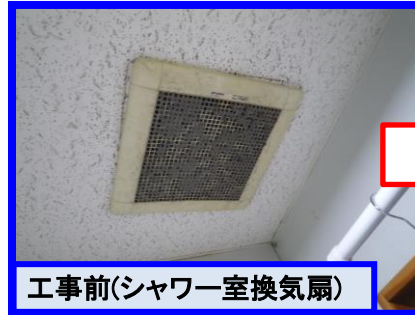
工事前(シャワー室換気扇)