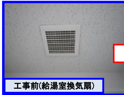
工事前(給湯室換気扇)