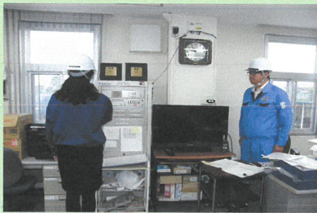
訓練開始を知らせる緊急通報状況（管理室放送設備より）

講義の中で紹介のあった「就寝中に突然の大地震発生時の床面ガラス破片による負傷防止に、枕元に靴を常備しておくことが有効」との体験談が印象に残りました。すぐにでもできる身近な対策として各家庭での実施をおすすめいたします。