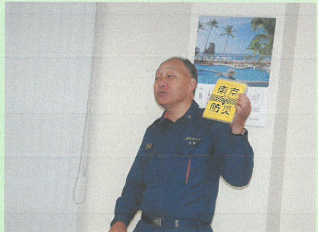
志村消防署高島平出張所係員による訓練講評および講義