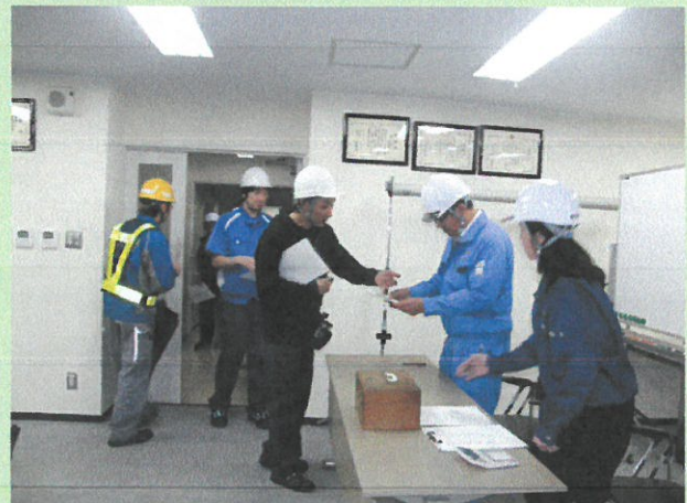
自衛消防隊本部にて各テナント避難者数報告受付状況（管理棟 2 階会議室）