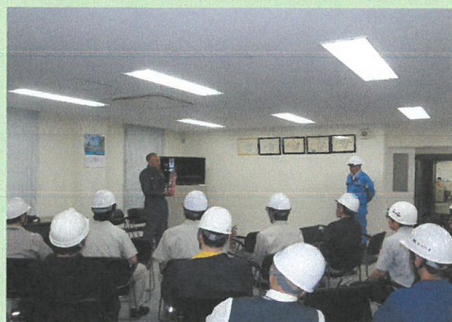
講評・講義会場風景

* 次回は半年後の11月に開催を予定しております。一人でも多くの参加をお待ちしております。