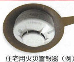
住宅用火災警報器（例）