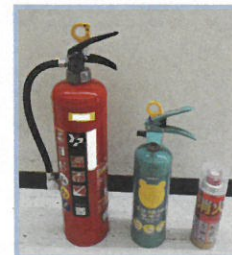
消火器・住宅用消火器・エアゾール式消火具（例）

注意！ 悪質な訪問販売、点検には注意しましょう 使用期限を守り、劣化に注意しましょう