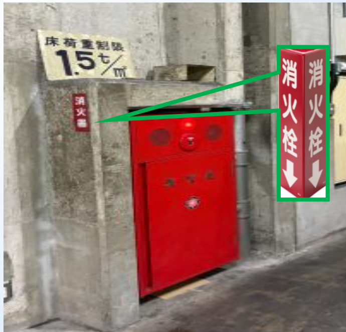
庫内床補修工事 対象箇所