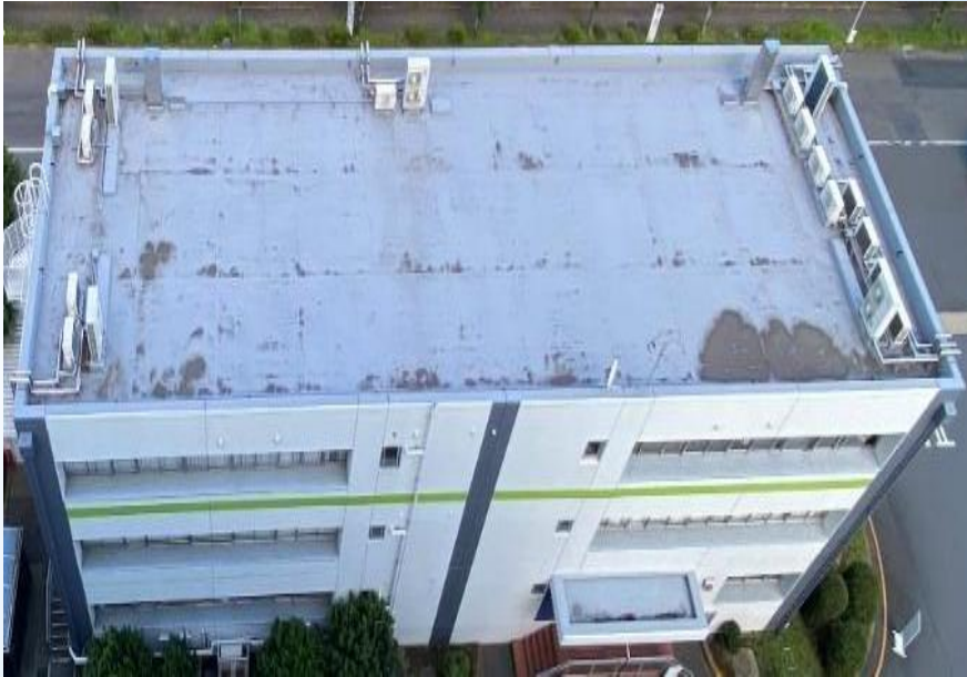
管理棟屋上防水塗装工事 対象箇所