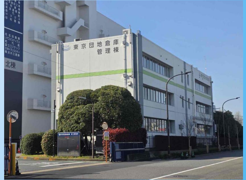
管理棟外壁防水塗装工事 対象箇所