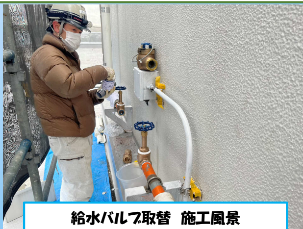
給水バルブ取替 施工風景