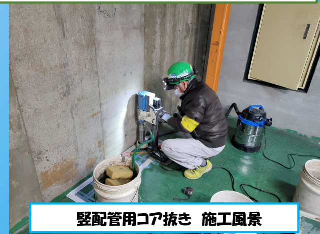
縦配管用コア抜き 施工風景