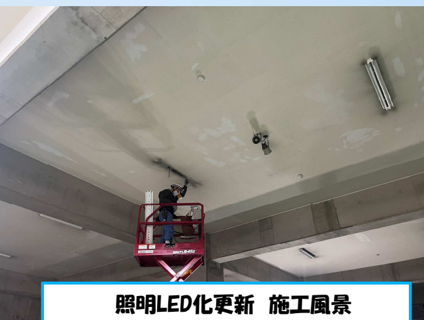
照明LED化更新 施工風景

各工事ともに対象テナント様へは別途事前にご案内をさせていただきます。 ご不明点等ございましたら管理室までご連絡ください。