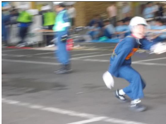
誰かいますか 火事です