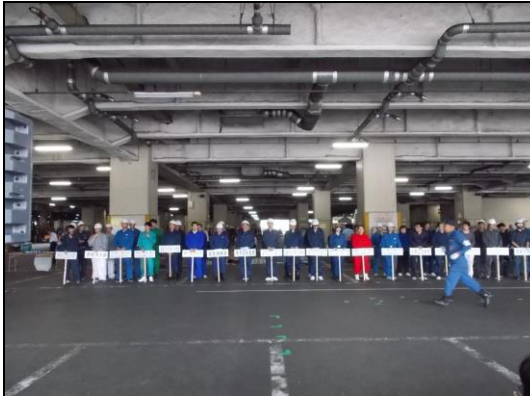
12時半 審査会が始まりました