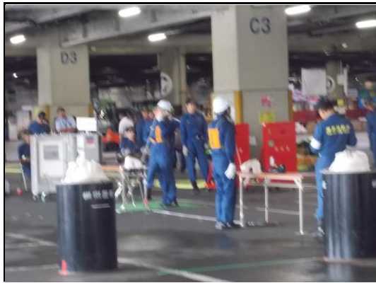
防災センターへ 消火不能の報告