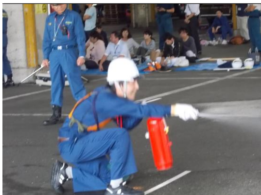
ピンを抜き レバーを握り 放水