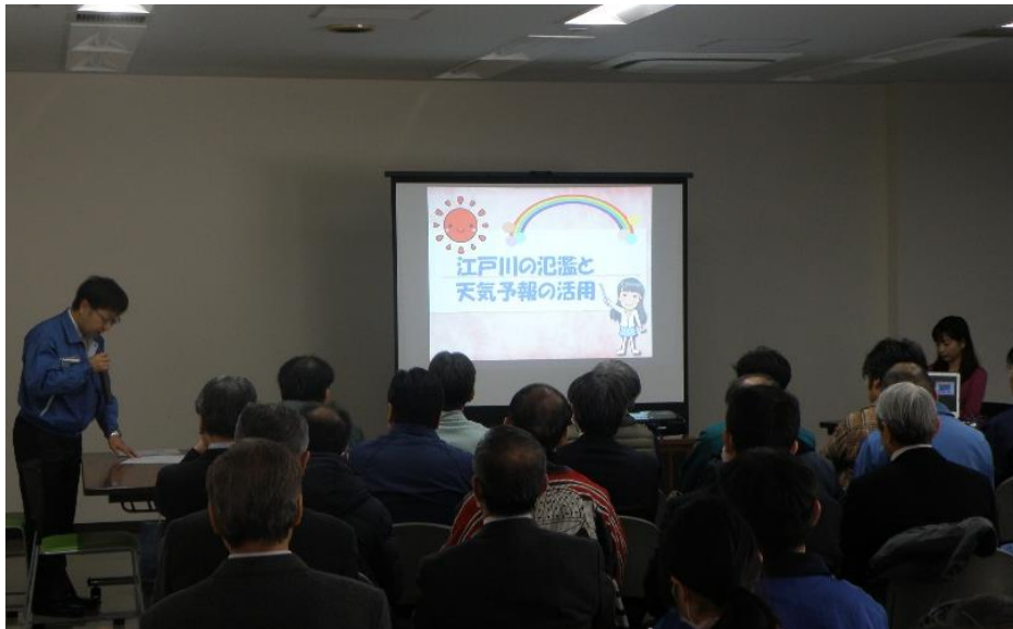
いよいよ、防災講演会の開演です。多くの方々にお集まりいただきました。