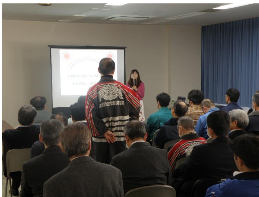
最後のクイズもとても興味深く、為になりました。天気予報って、明日の天気だけじゃないんですね。